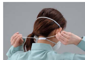
ベルトの長さ調整が可能