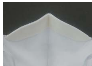
フィット感を高めるノーズシール